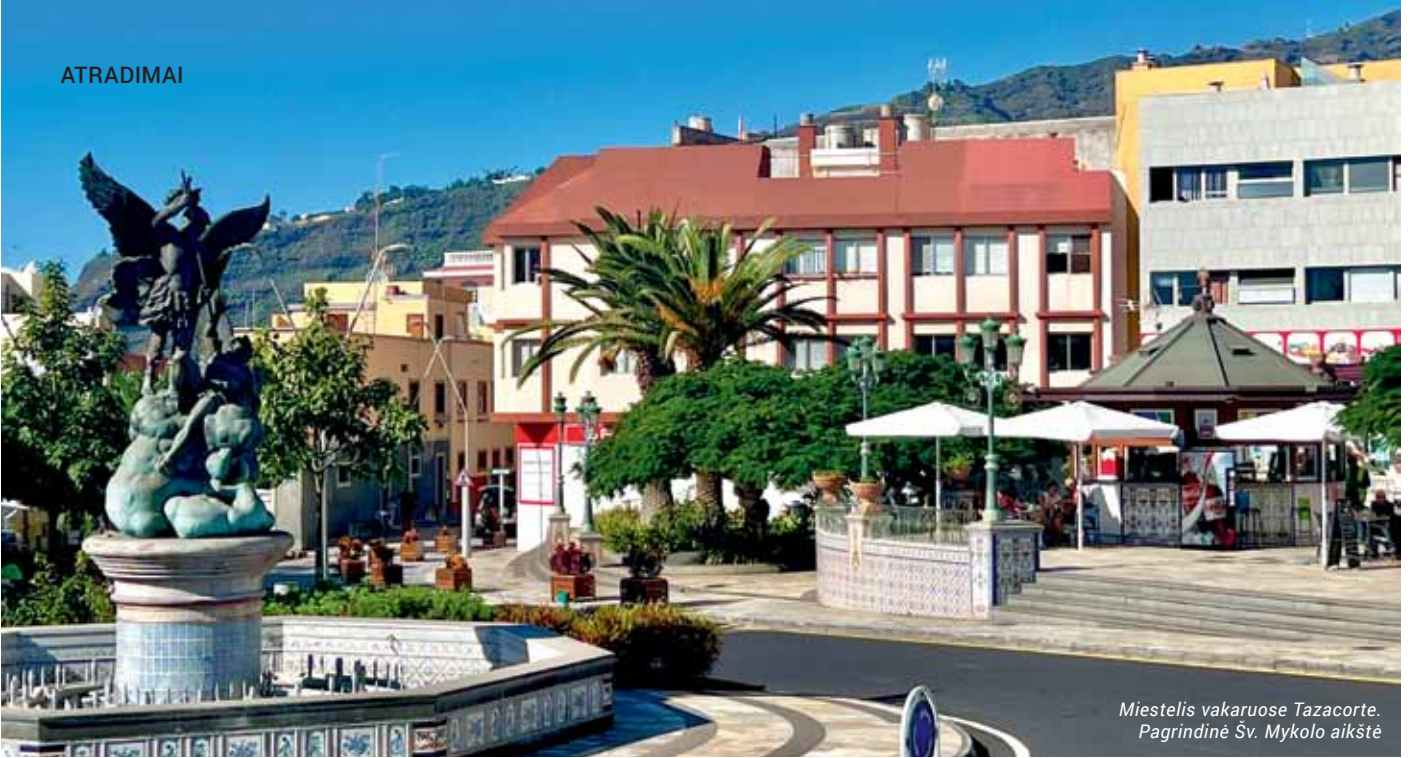
Miestelis vakaruose Tazacorte. Pagrindinė Šv. Mykolo aikštė