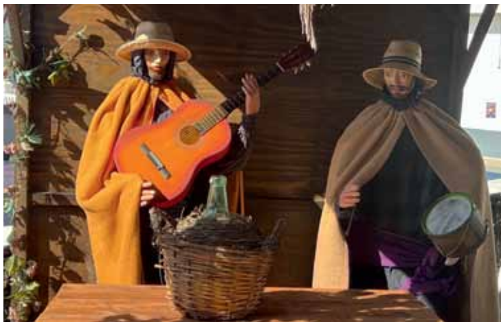
Parko prakartėlėje yra ir muzikantų