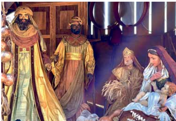
Šventoji šeima El Paso parke