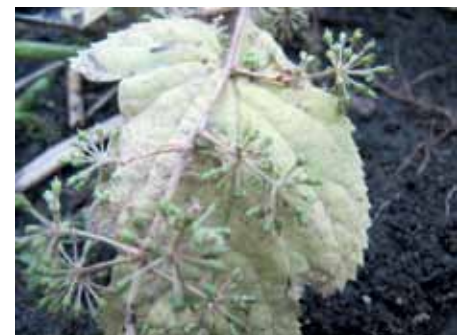
Miltligės sukėlėjas ant žiedyno ir lapų