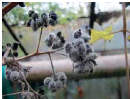
Pilkasis kekeras ant nokstančių vaisių