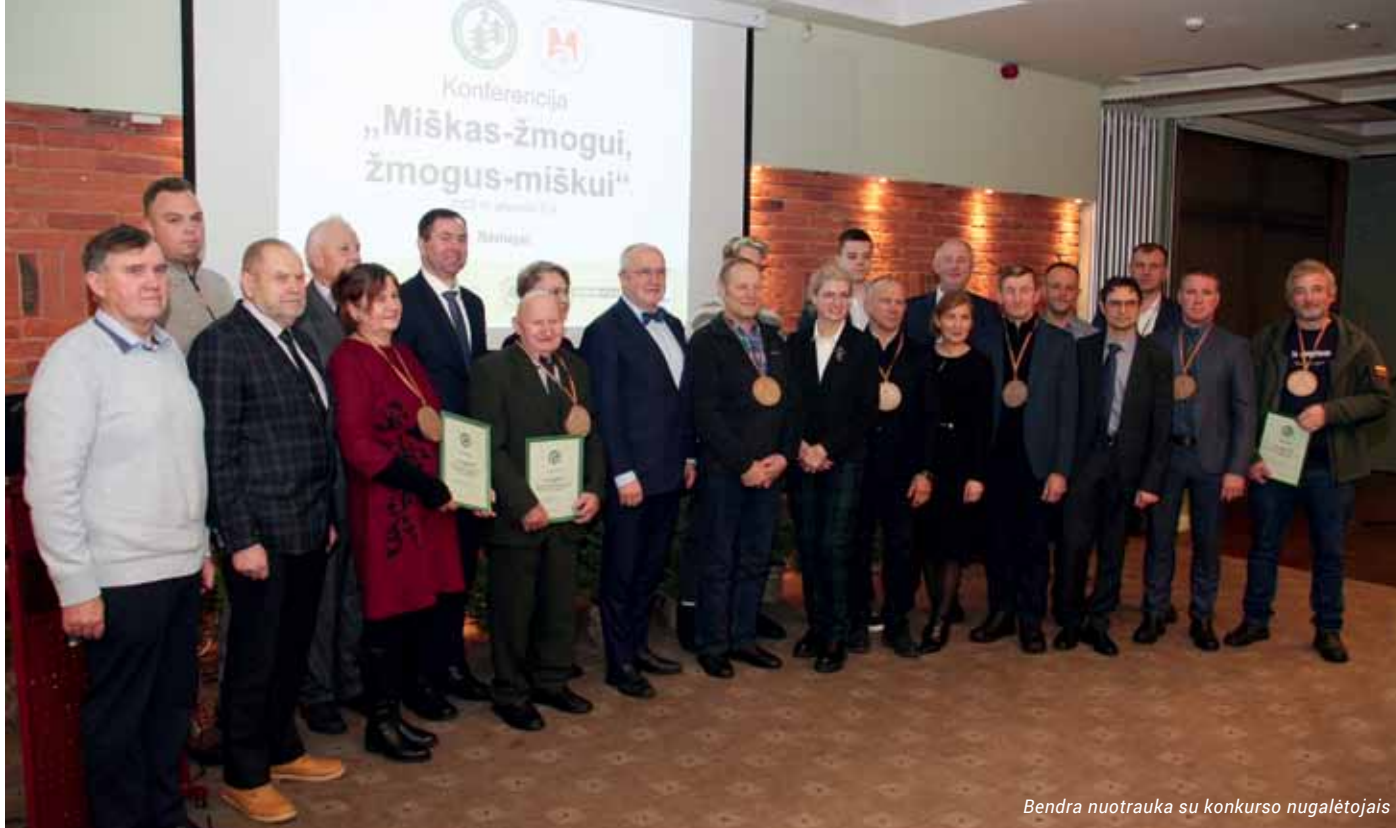
Bendra nuotrauka su konkurso nugalėtojais