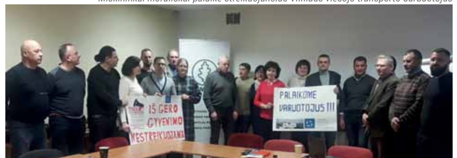
Miškininkai morališkai palaikė streikuojančius Vilniaus viešojo transporto darbuotojus

Naudodamasi proga LMPF vardu sveikinu visus miškininkus su Kalėdomis, Naujaisiais metais! ... kad 2023 metais nestigtų sėkmės ir laimės, o sudėlioti tikslai būtų įgyvendinti neskubant, bet kantriai, tvirtai ir iki galo! Gerų metų JUMS!