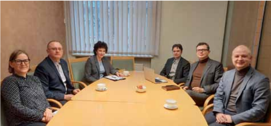
VMU darbuotojų reikalus tenka spręsti ir su Aplinkos ministerijos vadovais