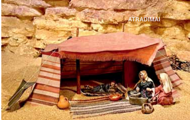
Sostinės Santa Cruz de La Palma savivaldybės prakartėlė tarsi dykuma, kurioje šventoji šeima daug kukliau įsitaisiusi

Baigiantis neeiliniams 2022-iesiems ir prasidedant visiškai nežinomiems 2023-iesiems metams, labiausiai tinkantis palinkėjimas būtų, aišku be palinkėjimo visada turėti pakankamai šlamančių kišenėje, artimų draugų ir tvirtą sveikatą, nebūk višta, skaityk, galvok, rinkis ir nebijok skristi. Net jei sakė, kad višta to negali. Jie tiesiog nematė. Gink savo lizdą, vištidę, žemę kurioje ji stovi. Net višta, kai jai pačiai ar jos lizdui gresia pavojus, tampa tikru vilku.