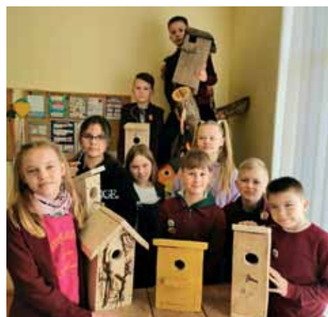
II vieta – Jurbarko r. Veliuonos Antano ir Jono Juškų gimnazija, JMB „Girinukas“