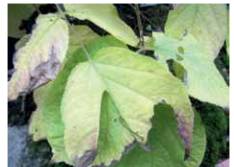
Lapgraužių sukeltos lapų pažaidos