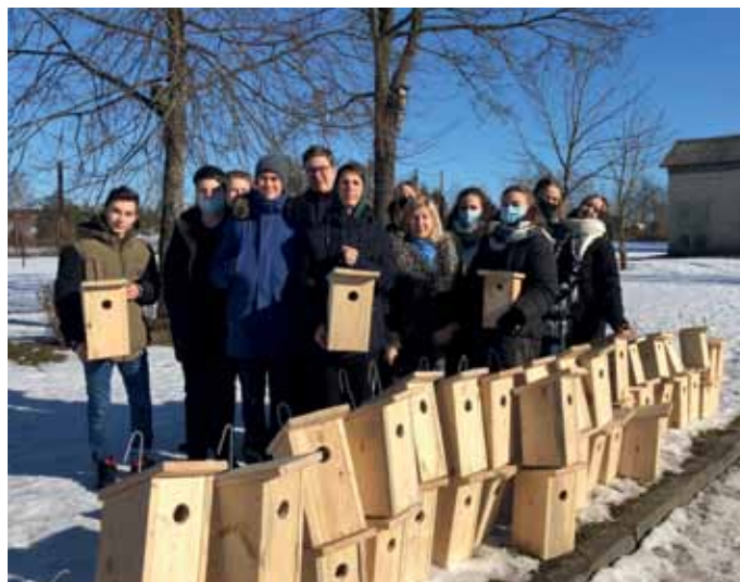
I vieta – Švenčionių Zigmo Žemaičio gimnazija, JMB „Žuvėdra“