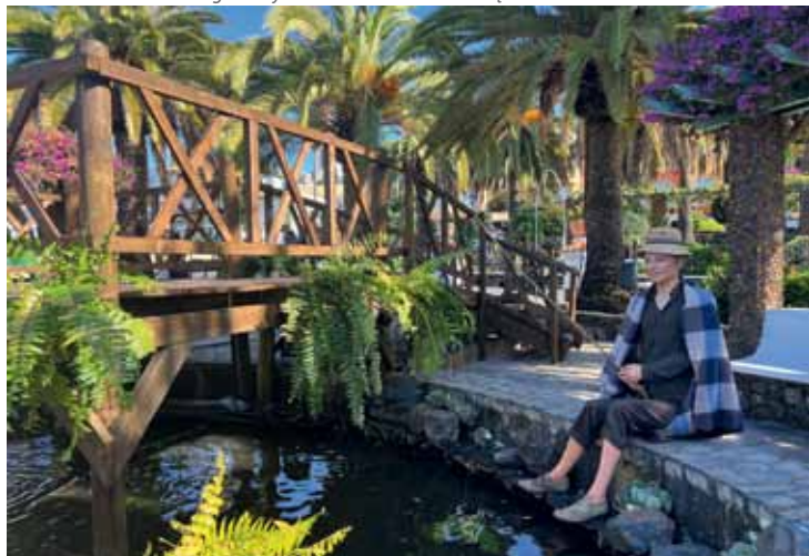
Miestelyje El Paso prakartėlė įrengta parke. Žmogaus dydžio manekėnai užsiėmę kasdieniais darbais