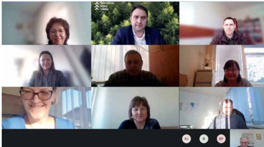
Daug Jungtinės atstovybės konsultacijų ir derybų vyksta per nuotolį

Taip pat norėtusi, kad JA turėtų galimybę dalyvauti visuose veiklos optimizavimo sprendimų procesų etapuose, ypač pradinuose, o ne vien tik galutinėje derinimo stadijoje. Taip būtų išvengiama nesusipratimų, skirtingo teisės normų traktavimo, o procesai vyktų