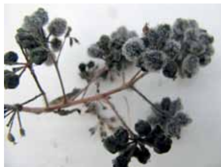
Pilkasis kekeras ant nukritusių vaisių