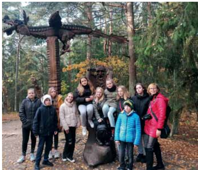
III vieta – Panevėžio r. Paliūniškio pagrindinė mokykla, JMB „Gamtos bičiuliai“